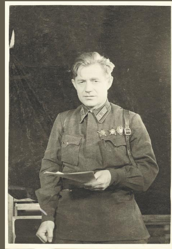
Алексей Александрович Сурков

- Во время подмосковных боев, - рассказывал поэт-фронтовик Алексей Сурков при встрече с истринцами, - я написал самое главное стихотворение – «В смертном ознобе под ветром трепещет осина», в котором – и этим горжусь – угадал кое-что в кровавой судьбе фашистов...».